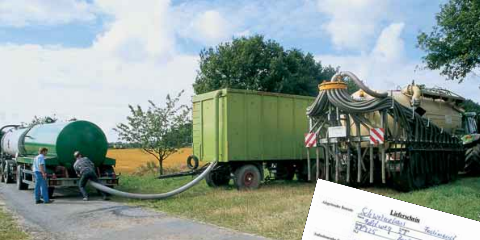
Der ausgefüllte Lieferschein muss bei jedem Transport organischer Dünger dabei sein. Nach erfolgter Abgabe werden die Daten in die Zentrale Datenbank übernommen.